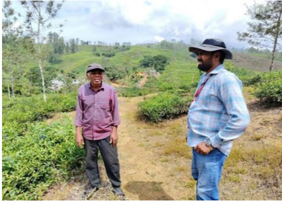
சரிவுப் பகுதி குடியிருப்பாளருடன் கலந்தாலோசனை