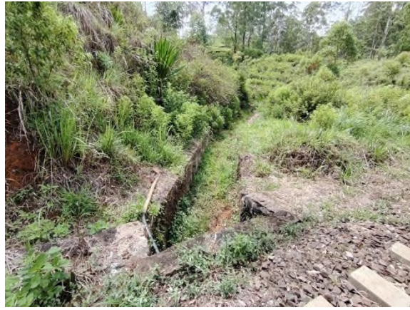
படம் 5g: சிறு பாலங்கள், அப்பகுதியின் தாவரங்கள் மற்றும் சமூக நீர் விநியோகக் குழாய்கள்