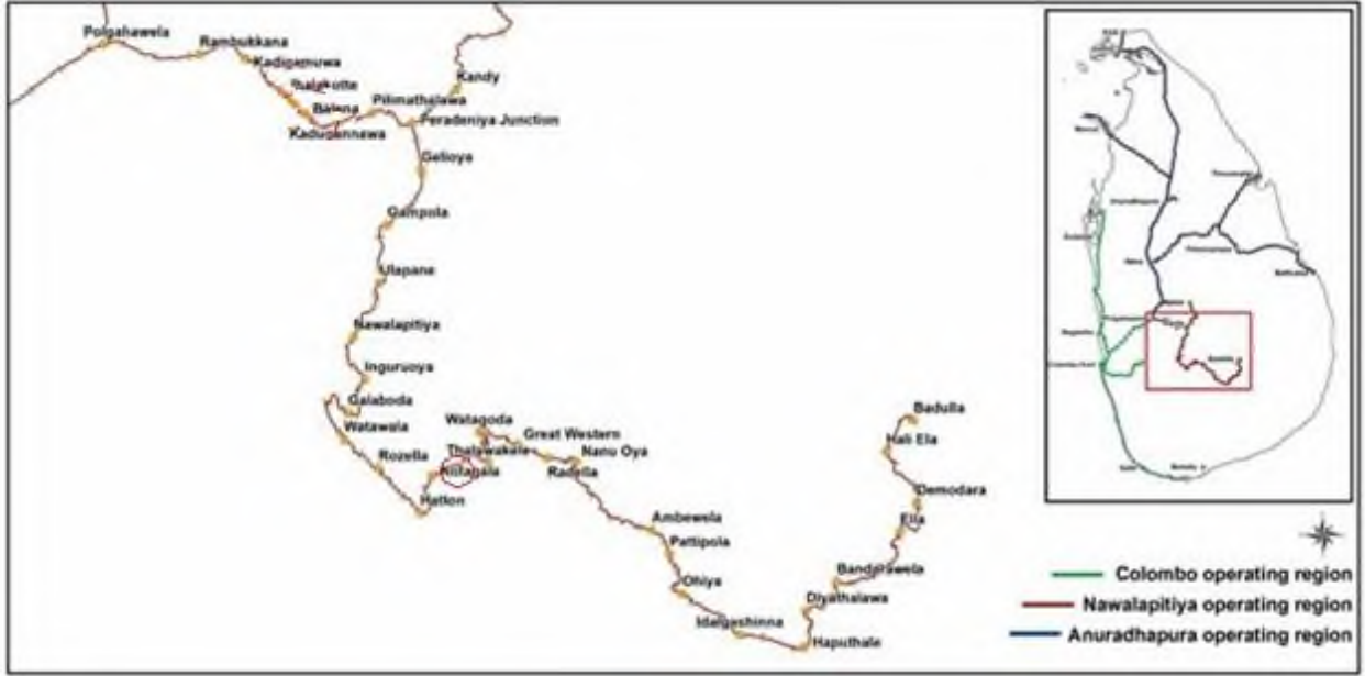
படம் 1: பிரதான புகையிரத பாதையில் முன்மொழியப்பட்ட நிலச்சரிவு தணிப்புத் தளங்கள்

படம் 1 மற்றும் 2ஐப் பார்க்கவும்; பிரதான புகையிரத பாதையில் முன்மொழியப்பட்ட நிலச்சரிவு தணிப்புத் தளங்கள் மற்றும் தளம் எண் 230-க்கான அணுகல் வழியைக் காட்டும் வரைபடம்.