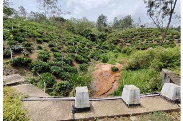
படம் 5d: பருவகால நீரோடை மற்றும் சமூக நீர் விநியோகக் குழாய்கள்