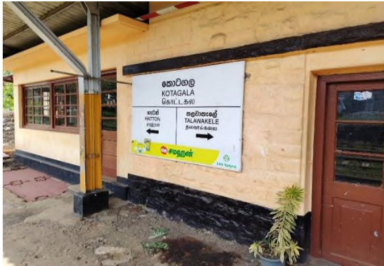
படம் 5c: கொட்டகலை புகையிரத நிலையம்