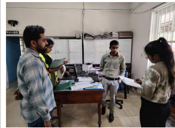
கிரேக்லி தோட்ட கணக்காளருடனான கலந்தாலோசனை