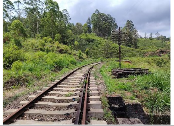
படம் 5b: கொட்டகலவிலிருந்து தலவாக்கலை வரையிலான புகையிரத பாதையின் குறுக்கே செல்லும் மின்சாரக் கம்பி.