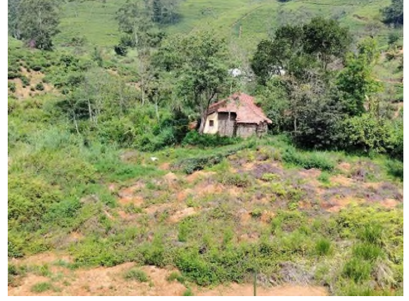
படம் 5f: சரிவின் கீழ்ப்பகுதியில் உள்ள மருத்துவமனையின் வரலாற்றுச் சிறப்புமிக்க வார்டு கட்டிடம்