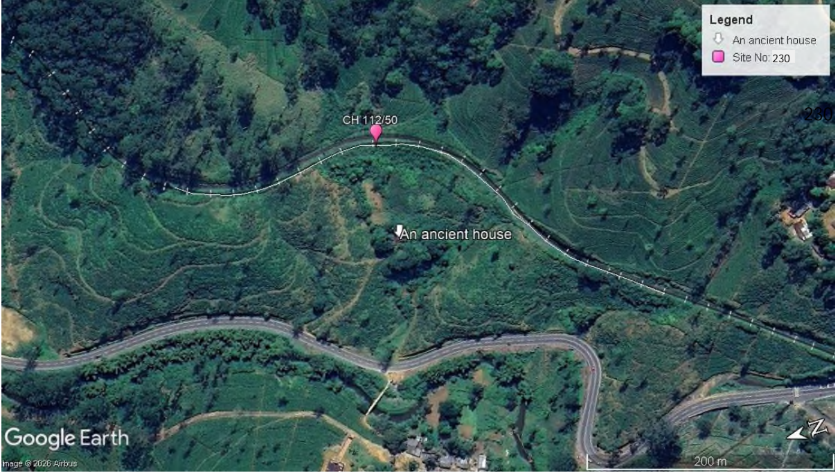
படம் 3: முன்மொழியப்பட்ட நிலச்சரிவுத் தணிப்புத் தளம் 230, சுற்றியுள்ள சுற்றுச்சூழல் அம்சங்கள் மற்றும் சேவை உள்கட்டமைப்பு ஆகியவற்றின் கூகுள் படம்.

படம் 3-ஐப் பார்க்கவும் முன்மொழியப்பட்ட நிலச்சரிவுத் தணிப்புத் தளம் எண் 230, சுற்றியுள்ள சுற்றுச்சூழல் அம்சங்கள் மற்றும் சேவை உள்கட்டமைப்பு ஆகியவற்றின் கூகுள் படம்.