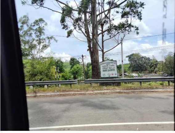
படம் 5e: சரிவில் உள்ள பிரதான சாலை மற்றும் கிரேக்லி தோட்டத்தின் பெயர் பலகை.