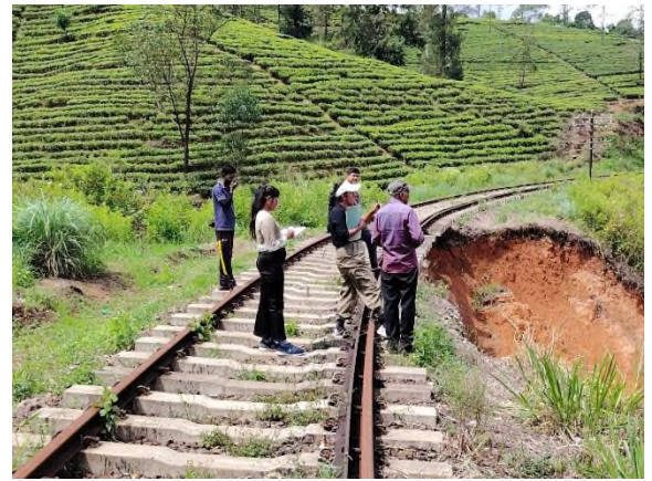
படம் 5h: மேட்டுப்பகுதியில் உள்ள கிரேஜிலியா எஸ்டேட்

படம் 5: திட்ட நடவடிக்கைகளால் பாதிக்கப்படக்கூடிய உணர்திறன் கூறுகள் மற்றும் தணிப்பு நடவடிக்கையால் சேதமடைந்த கூறுகள்