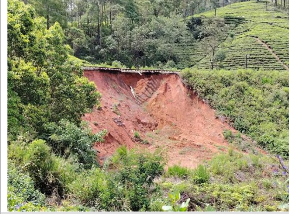
படம் 5a: சரிவு முறிவு மற்றும் சேதமடைந்த புகையிரத விரிசலின் தோற்றம்

(குறிப்பு படம் 5: திட்ட நடவடிக்கைகளால் பாதிக்கப்படக்கூடிய உணர்திறன் கூறுகள் மற்றும் சேதமடைந்த கூறுகள்)