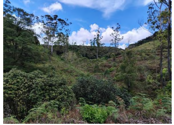
படம் 5d: மேட்டுப்பகுதி வனப்பகுதியில் மகா-ரத்மல் போன்ற அகணியத் தாவரங்கள் காணப்பட்டன.