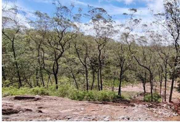
படம் 5: அவ்விடத்தின் சரிவான பகுதியில் தாவரங்கள் அடர்ந்துள்ளன, மேலும் ஊற்று நீர் வடிகால்கள் வழியாக இந்த சதுப்பு நிலத்திற்குப் பாய்கிறது.

படம் 5: திட்ட நடவடிக்கைகளால் பாதிக்கப்படக்கூடிய உணர்திறன் கூறுகள் மற்றும் தணிப்பு நடவடிக்கையால் சேதமடைந்த கூறுகள்