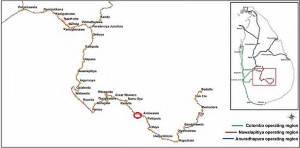
படம் 1: பிரதான புகையிரத பாதையில் முன்மொழியப்பட்ட நிலச்சரிவு தணிப்புத் தளங்கள்

படம் 1 மற்றும் 2-ஐப் பார்க்கவும்; பிரதான புகையிரத பாதையில் முன்மொழியப்பட்ட நிலச்சரிவு தணிப்புத் தளங்கள் மற்றும் தளம் எண் 228 க்கான அணுகல் வழியைக் காட்டும் வரைபடம்.