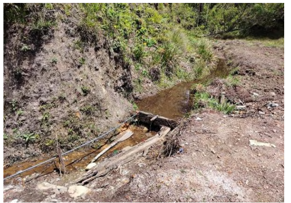
படம் 5h: மேட்டுப்பகுதியிலிருந்து வரும் ஊற்று நீர்