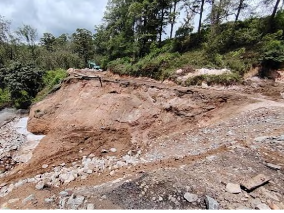
படம் 5c: தாவரங்கள் மற்றும் வெள்ளத்தில் அடித்துச் செல்லப்பட்ட புகையிரத பாதை. இது பயணிகளுக்கான அணுகு சாலையாகப் பயன்படுத்தப்படுகிறது.