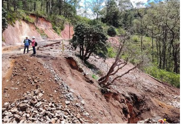
படம் 5f: மகா-ரத்மல் ஆன செங்குத்தான மற்றும் விரிசல் விட்ட சரிவு