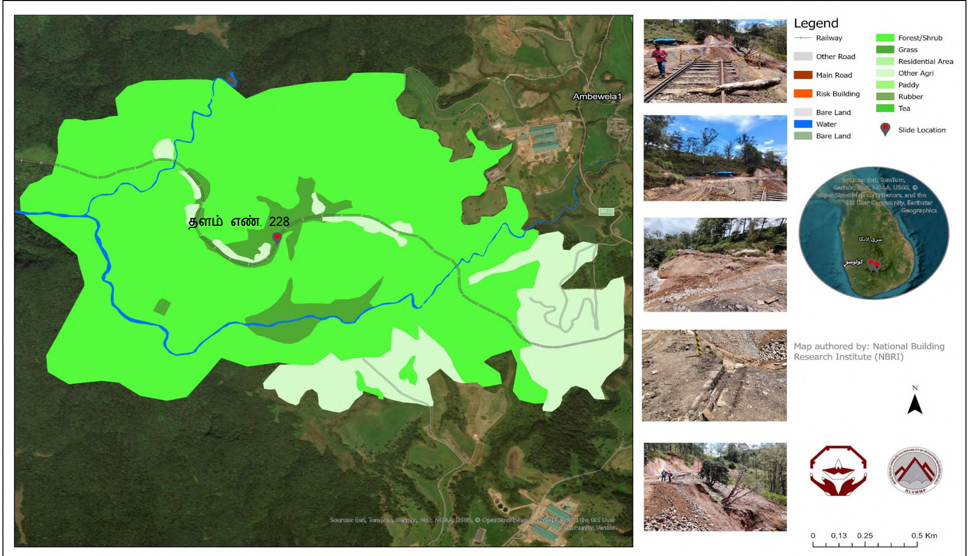
படம் 4: கூகுள் படம், நிலப் பயன்பாடு, இடர் கூறுகள் மற்றும் இடங்களின் புகைப்படங்கள்