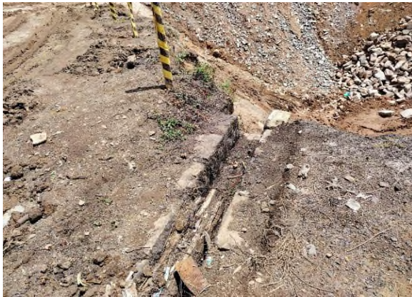
படம் 5g: குப்பைகளால் அடைக்கப்பட்டிருக்கும் சிறுபாலத்திற்கு அருகிலுள்ள இடம்