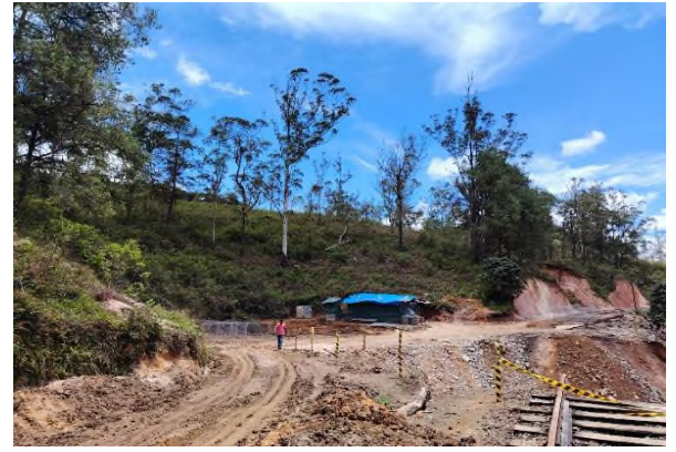
படம் 5a: தள எண்: 228 (134 மீ 78சிகெச்) நானுலையவிலிருந்து அம்பேவெல நிலையம் வரையிலான வெள்ளத்தில் அடித்துச் செல்லப்பட்ட புகையிரத பாதை