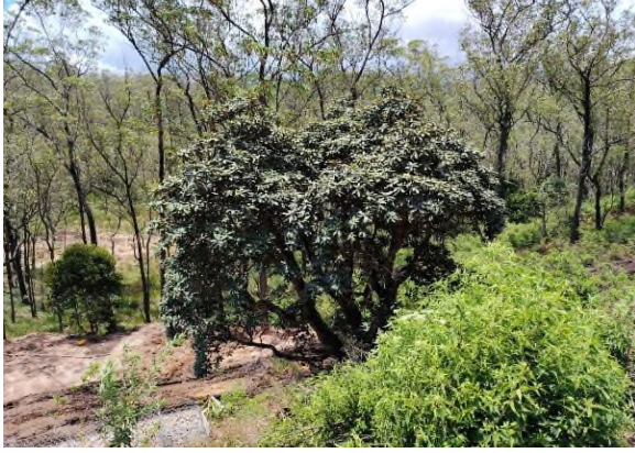
படம் 5e: மகா-ரத்மல், டர்பன்டைன் மற்றும் பிற புதர்களுடன் கூடிய சரிவுப் பகுதித் தாவரங்கள்.