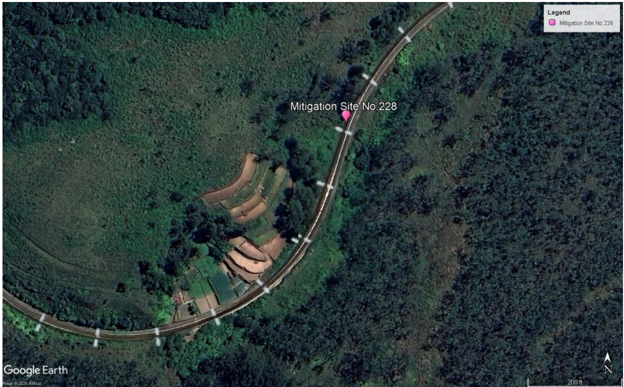
රූපය 3. යෝජිත ආපදා අවම කිරීමේ ස්ථානය අංක 228 හා අවට පාරිසරික ලක්ෂණ සහ සේවා යටිතල පහසුකම් පිළිබඳ ගූගල් රූපය.

(වැඩිදුර අධ්‍යයනය සඳහා: යෝජිත ආපදා අවම කිරීමේ ස්ථානය අංක 228 හා අවට පාරිසරික ලක්ෂණ සහ සේවා යටිතල පහසුකම් පිළිබඳ ගූගල් රූපය 3 බලන්න)