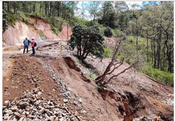
රූපය 5f: හානියට පත් පහළ බෑවුමේ ඇති මහාරත්මල් ශාක