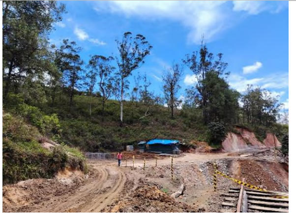
රූපය 5b: ටර්පන්ටයින්, පයින්ස් සහ මහා-රත්මල් වෘක්ෂලතාදිය සහිත ඉහළ බෑවුම ආසන්නයේ පිහිටි අවම කිරීමේ ස්ථානය