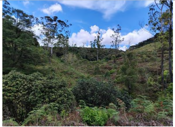
රූපය 5d: ඉහළ බෑවුම් වනාන්තර ප්‍රදේශය මහාරත්මල් වැනි ආවේණික ශාක වලින් සමන්විත වේ