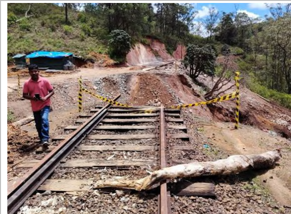
රූපය 5a: නානුඔය සිට අඹේවෙල දුම්රිය ස්ථානය දක්වා දුම්රිය මාර්ගය සෝදා ගොස්ඇත. ස්ථාන අංක: 228 (CH 134/78)

(වැඩි දුර අධ්‍යයනය සඳහා රූපය.5 ව්‍යාපෘති ක්‍රියාකාරකම් මගින් බලපෑමට ලක්විය හැකි සංවේදී ඒකක සහ හානි වූ ඒකක බලන්න)