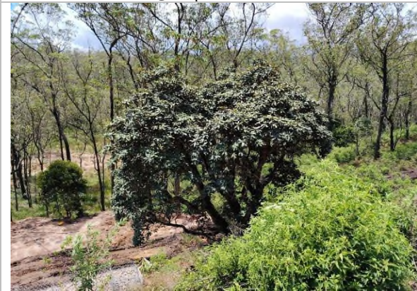
රූපය 5e: මහාරත්මල්, ටර්පන්ටයින් සහ අනෙකුත් පඳුරු සහිත පහළ බෑවුමෙහි වෘක්ෂලතාදිය