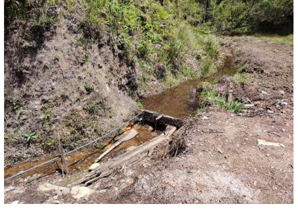
රූපය 5h: ඉහළ බෑවුමෙහි පිහිටි ජල උල්පත්