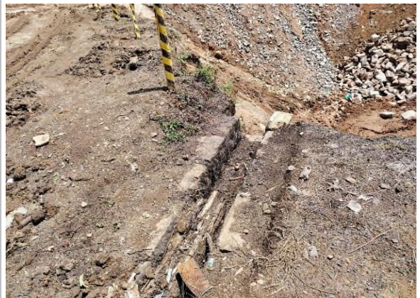
රූපය 5g: සුන්බුන් වලින් අවහිර වී ඇති ආසන්නයේ පිහිටි බෝක්කුව