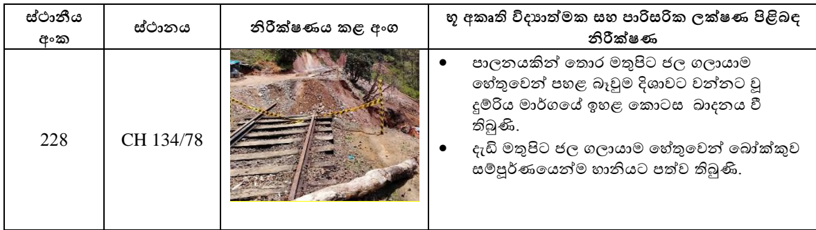
වගුව 1: අවම කිරීම සඳහා යෝජිත ස්ථානවල හු ආකෘති විද්‍යාත්මක සහ පාරිසරික ලක්ෂණ පිළිබඳ නිරීක්ෂණ