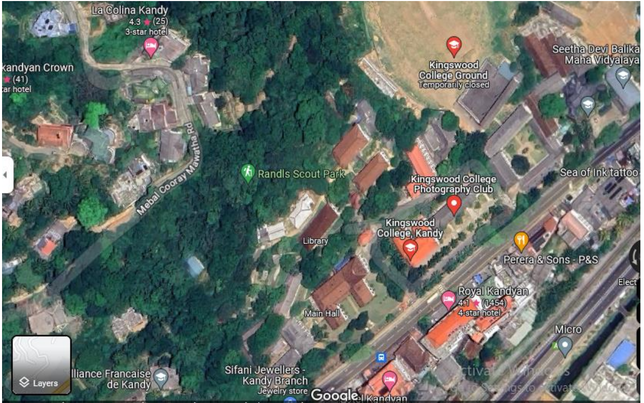
රූපය 2: යෝජිත නායයෑම් අවම කිරීමේ ස්ථානයේ ගුගල් රූපය, අවට පාරිසරික ලක්ෂණ සහ සේවා යටිතල පහසුකම්.