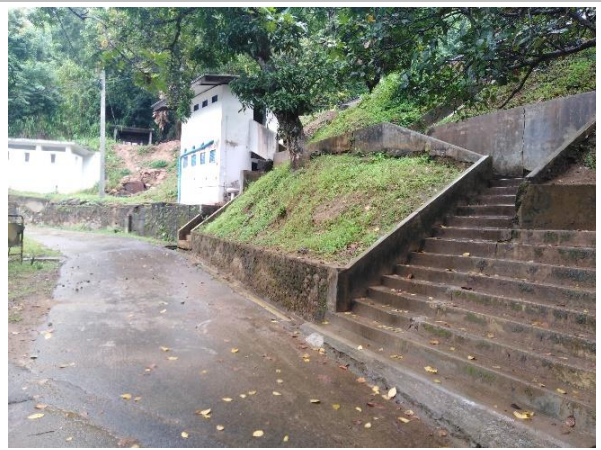
රූපය 6f: සී කොටසේ අංක 2 දරණ බාලක ස්නාන ස්ථානය ආසන්න පඩි පෙළ (L6)