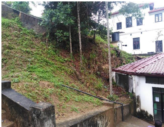
රූපය 6g: නේවාසිකාගාරය සහ පැරණි ආපන ශාලාව අතර ඉඩම් කොටස (L7)