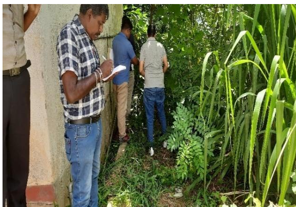
රූපය 6i: නැවුම් කාමරය සහ අලුතින් ඉදිකරන ලද මහල් 4 ක ගොඩනැගිල්ල අතර අස්ථායී බිම් කොටස (L9.)