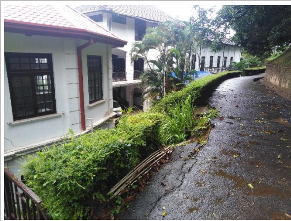
රූපය 6e: ගුරු සනීපාරක්ෂක පහසුකම් සහ ගෘහ විද්‍යාගාරය පිටුපස බිඳවැටුණු මාර්ගය සහ බෑවුම් කොටස (L5)