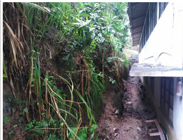
රූපය 6c: කලා ගොඩනැගිල්ල පිටුපස බැවුම් කොටස (L3)