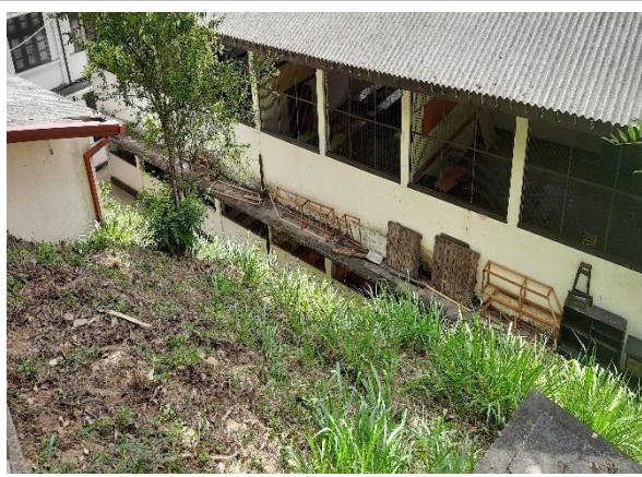
රූපය 6b: වාණිජ ගොඩනැගිල්ල ඉදිරිපිට (සනීපාරක්ෂක පහසුකම් සහිත ස්ථානයට දකුණු පසින් ) (L2)