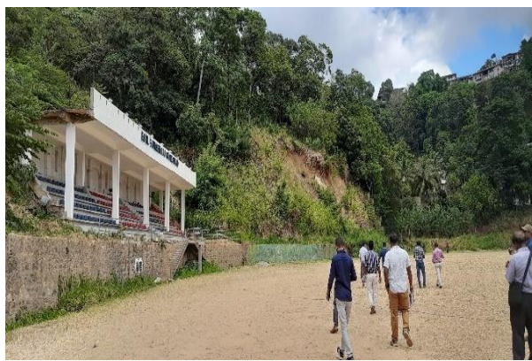
රූපය 6j: ක්‍රීඩා මණ්ඩපය ආසන්නයේ බෑවුම (L10)

රූපය 6: ව්‍යාපෘති ක්‍රියාවන්ට බලපෑම් කළ හැකි සංවේදී අංග