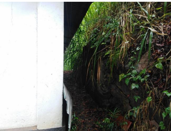
රූපය 6d: 12 ශ්‍රේණියේ තාක්ෂණික ගොඩනැගිල්ල සහ බුද්ධ ප්‍රතිමාව අතර බැවුම (L4)