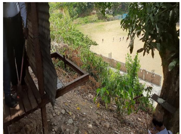
රූපය 6h: මුළුතැන්ගෙය සහ ක්‍රීඩා මණ්ඩපය අතර බෑවුම් කොටස(L8)