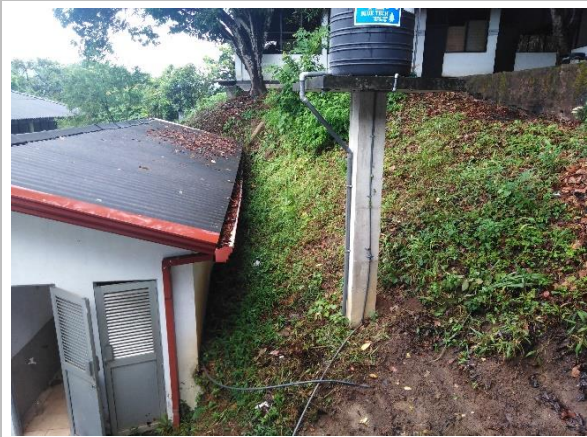
රූපය 6a: 12 ශ්‍රේණියේ වෙක් 2 ගොඩනැගිල්ල ඉදිරිපිට බැවුම (සනීපාරක්ෂක පහසුකම් පිටුපස) (L1)

(රූපය.6 ව්‍යාපෘති ක්‍රියාකාරකම් මගින් බලපෑමට ලක්විය හැකි සංවේදී අංග)